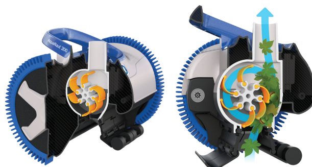
Tecnología patentada V-Flex®: turbina de álabes móviles para capturar los residuos grandes