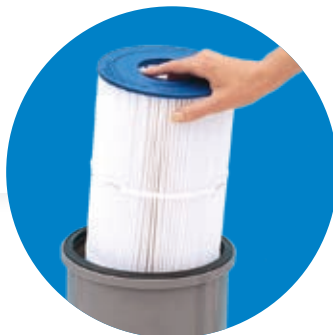
Medio filtrante de poliéster

Racores para facilitar las operaciones de instalación y sustitución