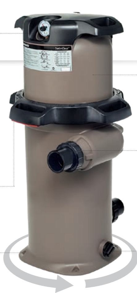
Filtro SwimClear™ monocartucho

Necesita poco espacio ideal para locales técnicos pequeños